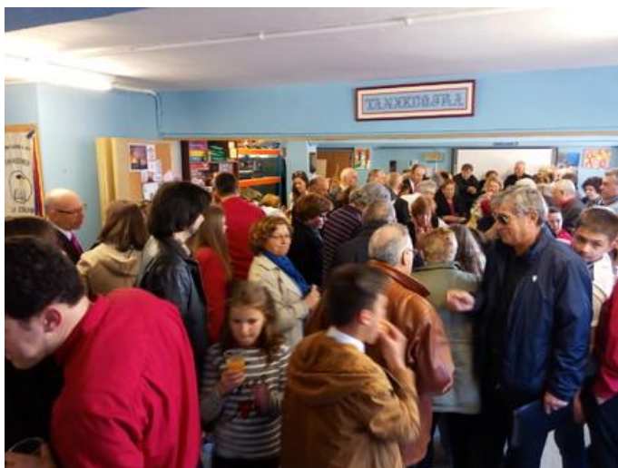
Algúns dos asistentes na festa Tanxedoira.

Ao rematar o Festival, todos os grupos dirixíronse ao local social de Tanxedoira co fin de compartir un agradable momento de confraternidade, degustando as deliciosas viandas que se ofreceron e, por suposto, non podía faltar o momento de música e cantares que puxeron punto final ao evento.