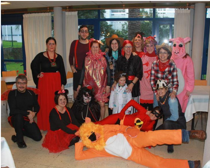
Alguns dos disfraces que alegraron a velada.

Os Tanxedoir@s considerámonos unha familia na que non pode faltar o AMOR. Por ese motivo, esa data en concreto, este ano foi máis especial se cabe, xa que a conxugamos cun evento moi especial: A nosa anual Laconada de Entroido!!!