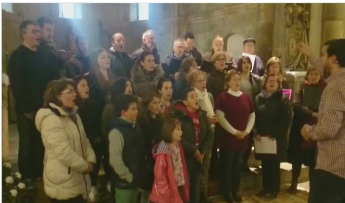
Un ensaio a proba de frío.

Neste país o sábado está para gozar e é algo que aos Tanxedoír@s nos gusta facer, así que non o dubidamos un momento e decidimos xuntarnos para cantar. Un ensaio diferente, un lugar distinto, a mellor compañía e, por suposto, un sábado. O sábado 16 de abril de 2016, o sábado en que o Coro de Tanxedoira deixou a un lado o típico ensaio no local social e soltaron as súas voces na igrexa do Mosteiro de Bergondo. Souberon a pouco as pezas que se ensaiaron de face ao festival do seu XXXVIII Aniversario ( O concerto, O Quam Amabilis, Os Cregos i os Taberneiros e, por suposto, Cumpleaños Feliz ). Cada vez máis se pode ver esa unión entre os coralistas, que ao final reflicte na calidade das interpretacións, ata nun marco tan serio é posible pasalo ben, así foi como se sentiron a maioría dos meus compañeiros.