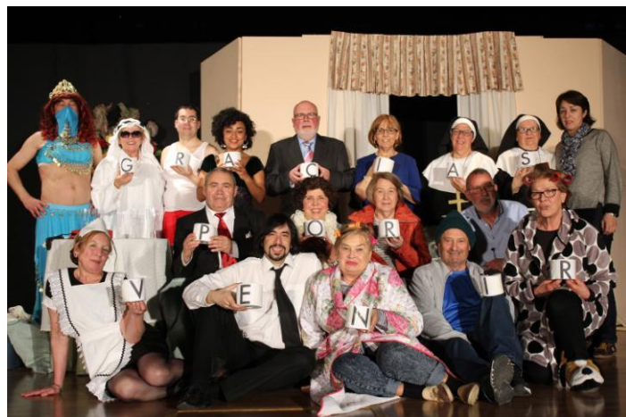
Cadro de actrices, actores e a técnico co seu director

Foron actuacións en que, tanto elenco como público, gozamos moito, e os aplausos recibidos, foron, sen dúbida, unha resposta moi alentadora para todo o grupo de Teatro Tanxedoira, porque tras investir o tempo e a ilusión que investimos preparando a obra, é unha alegría percibir que ao público lle gusta e demostránnolo coas súas risas, os seus bos comentarios e os seus aplausos.