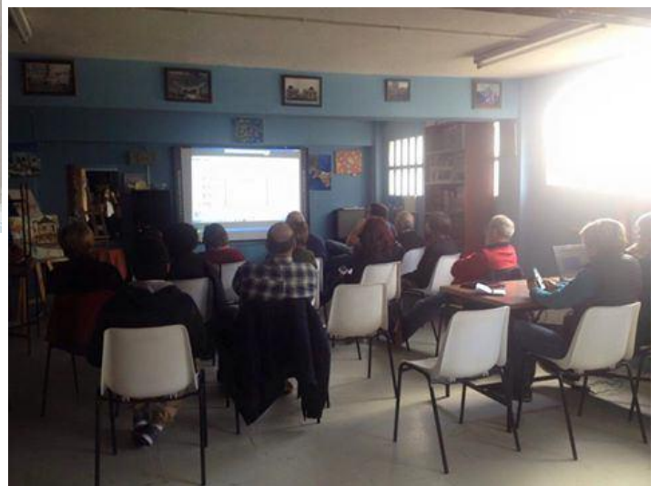
Os alumnos atentos ás explicacións.

Coa finalidade de profundar na formación musical que se ven impartindo aos compoñentes do coro e da rondalla, así como ao alumnado dos diferentes instrumentos que teñen as súas clases en Tanxedoira, facilitóuselles a posibilidade de participar nunha acción formativa adicada ao manexo de "Programas de edición musical", e que foi levada a cabo nas instalacións da Asociación o día 9 de Abril, tendo unha duración de catro horas.