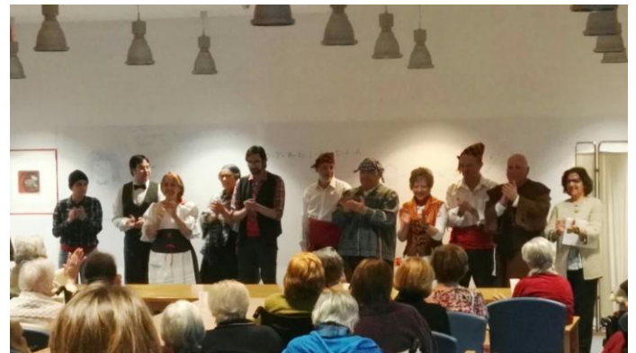
El Remanso. Recibindo os aplausos do público.

O día nove de febreiro, o Grupo de Teatro Tanxedoira volveu actuar, e esta vez fíxoo na residencia El Remanso, de Los Rosales, e representou dous fragmentos de dúas zarzuelas: La tabernera del puerto e La dolorosa .