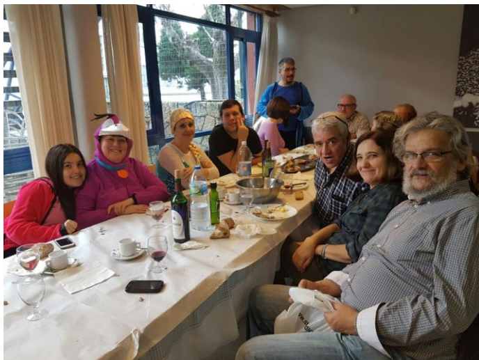
Unha das mesas e algúns dos disfraces.