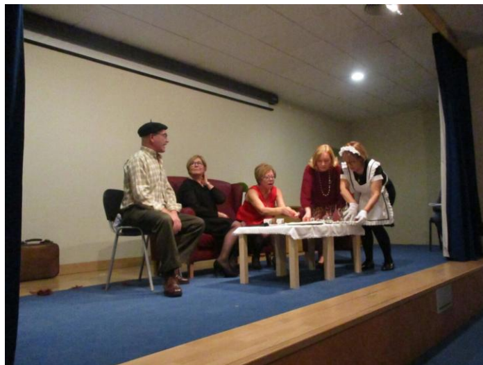
Unha escena da representación en Sar Quavitae.

Nesta ocasión foi un fragmento da obra de teatro La ciudad no es para mí , levada a cabo á grande pantalla no seu momento por Paco Martínez Soria.