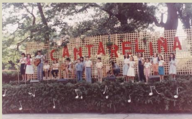
30/06/1984. A Asociación no Concurso Cantareliña.