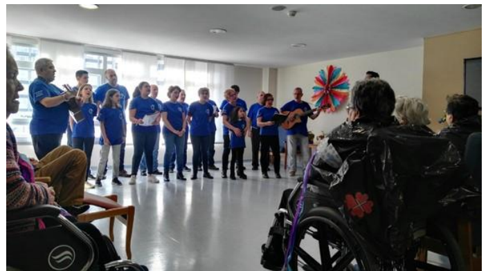
Guitarras e voces que quentan corazóns.

O repertorio, o habitual nestas ocasións: Clavelitos, Catro vellos mariñeiros, Yo vendo unos ojos negros, A Rianxeira etc.