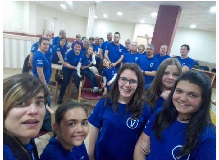
Os representantes de Tanxedoira..

O día 25 de Marzo, unha actuación de Tanxedoira levou alegría ás persoas maiores, neste caso a aquelas que teñen a súa residencia en SAR QUAVITAE. Asistiu un numeroso grupo de cantantes acompañado dalgúnhas guitarras, e interpretaron cancións populares que animaron aos asistentes.