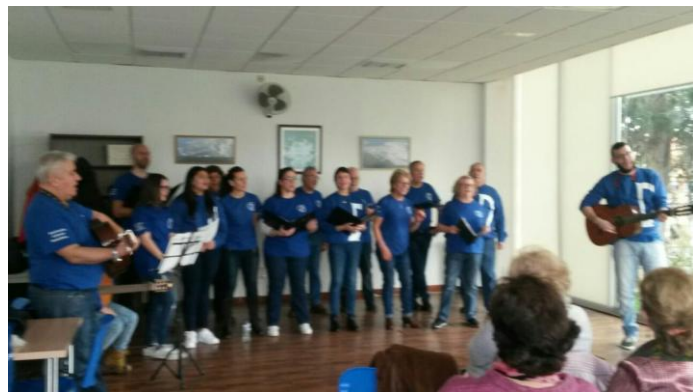
Alegrándolles a tarde aos asistentes.

Sábado 7 de Abril. Este ano a Asociación Cultural Tanxedoira cumpre 40 anos e vímolos celebrando ao grande. Estamos a percorrer os Centros Cívicos da Coruña cos nosos cantos populares e hoxe correspóndelle ao C. C. Santa Margarita. Ben, digo estamos, mais non me presenteí. Para quen non nos conexas, teño que dicir que somos o coro da Asociación Cultural Tanxedoira, e imos cantando as nosas cancións populares que toda a xente maior coñece. Alí onde imos alegrámo-lles a tarde e eles felices, pois participan connosco e dá gusto velos tan contentos.