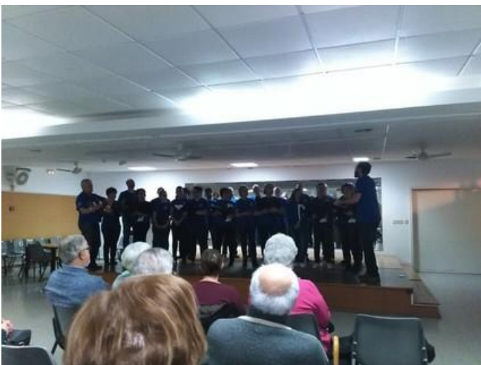
Actuación no barrio-berce de moitas agrupacións musicais.

E así, o pasado sábado, 27 de xaneiro, no salón de actos do seu centro cívico, ocupado por un nutrido grupo de veciños e veciñas, os e as compoñentes do cadro musical foron interpretando unha selecta variedade de cantos de "andar por casa" moi coñecidos e que, ben dirixidos polo seu novo director, animaron e atraparon cas súas notas a todos os presentes que, pouco a pouco, foron fundindo as súas voces cas da formación vocal, ao mesmo tempo que facían soar ritmicamente as palmas.