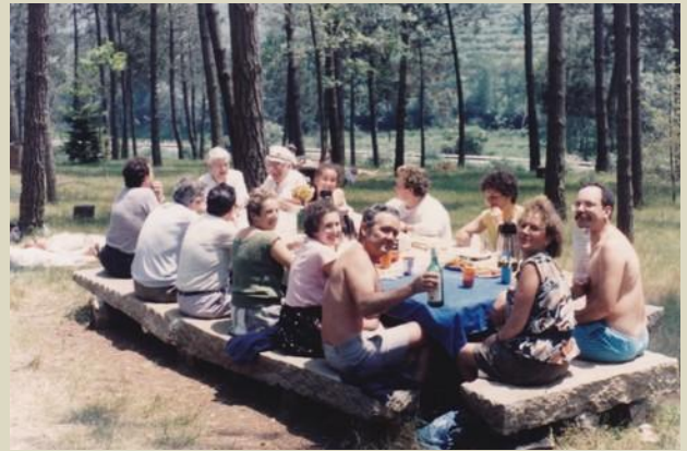
20/06/1988 Xantar na excursión fin de curso.

Fe de erratas.- A fotografía incluída no boletín de Xaneiro 2018, no apartado "Aqueles maravillosos anos", tivo lugar no local do Mercado de Elviña, no ano 2002, e non no lavadoiro de Monelos.