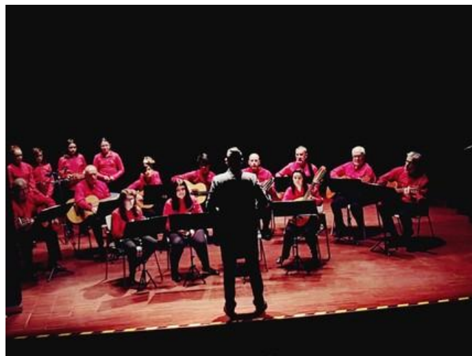
Participación da Rondalla Tanxedoira.

O pasado 24 de febreiro tivo lugar no Centro Cívico dos Mallos o certame de rondallas con motivo dos nosos 40 anos de historia. Os grupos convidados nesta ocasión foron a Agrupación Carlos Seijo, de Betanzos; a rondalla Latexos, de Foz; e a rondalla Alecrín, de Ourense. Con todas elas, como vedes, tentouse ter unha representación de cada provincia da Galiza.