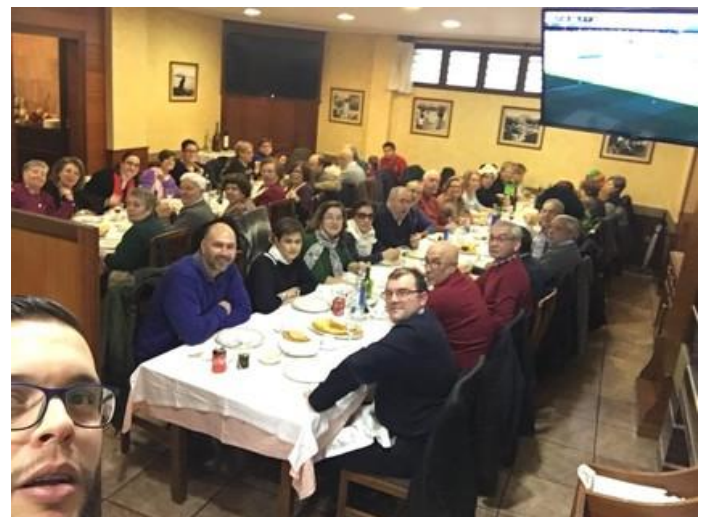
Despois de ben comidos e ben bebidos.

A animación de tres guitarristas aumentou a ledicia reinante toda vez que se sumaron aos cantos outros grupos que estaban no restaurante.