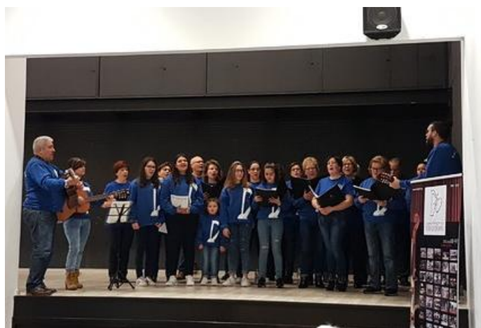
Animando o tempo da tarde.