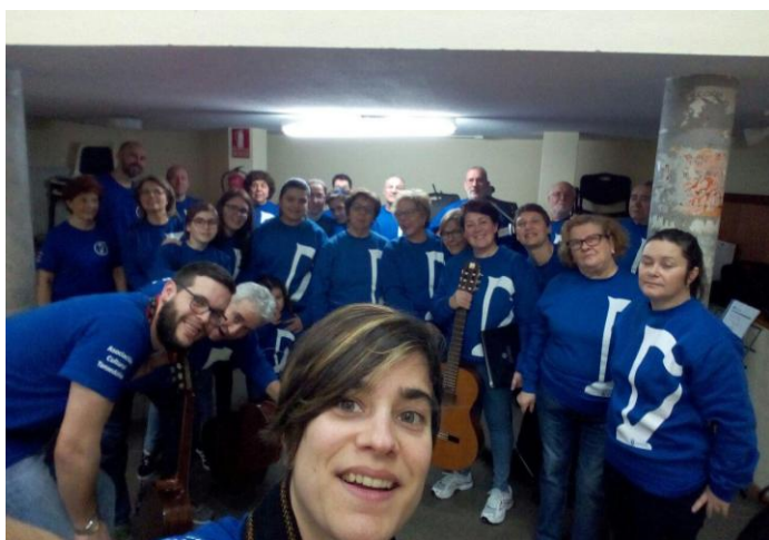
Listos para saír ao escenario.

O sábado 10 de marzo fomos actuar ao Centro Cívico da Sagrada Familia. Alí cantamos moitas pezas populares e o público estaba encantado. De feito, un señor pasou a meirande parte da actuación gravando co seu marabilloso iPhone 5.