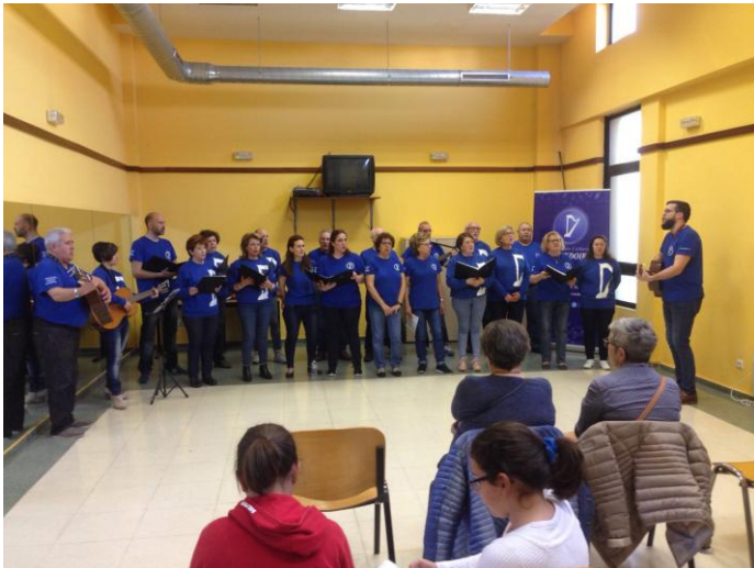
Enchendo o espazo de notas musicais.

O pasado día 5 no Centro Cívico de San Pedro de Visma, membros do Coro e Rondalla, puxeron punto e final, a un ano de actuacións polos Centros Cívicos da cidade.